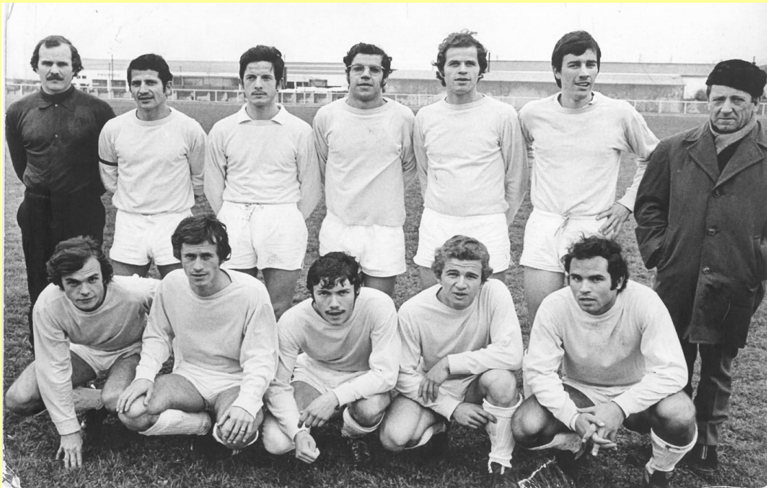
Photo prise en Saône-et-Loire à la fin des années 1970