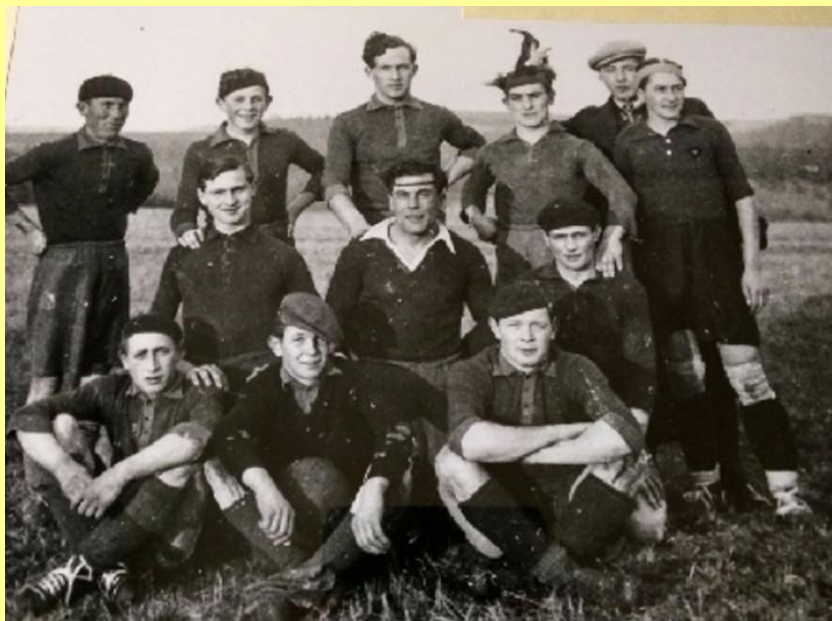
Equipe de 1937